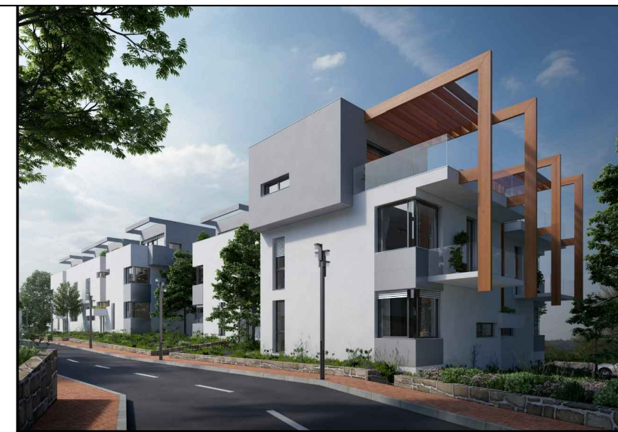
situacija objekat 8

napomena: moguća su minimalna odstupanja usled postavljanja konstruktivnih elemenata i instalacionih vertikalna