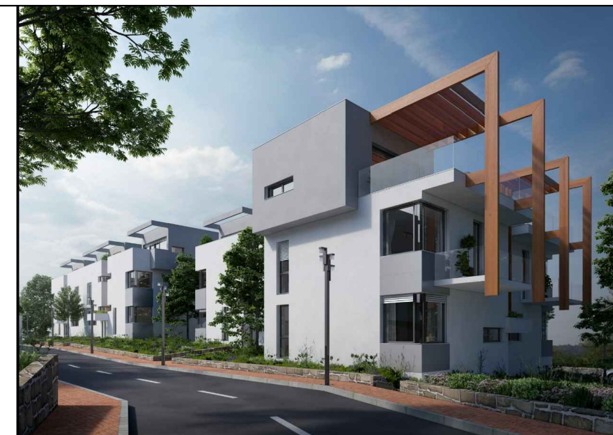
situacija objekat 8

napomena: moguća su minimalna odstupanja usled postavljanja konstruktivnih elemenata i instalacionih vertikalna